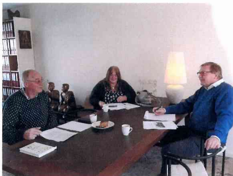
Bestuur van de stichting in vergadering