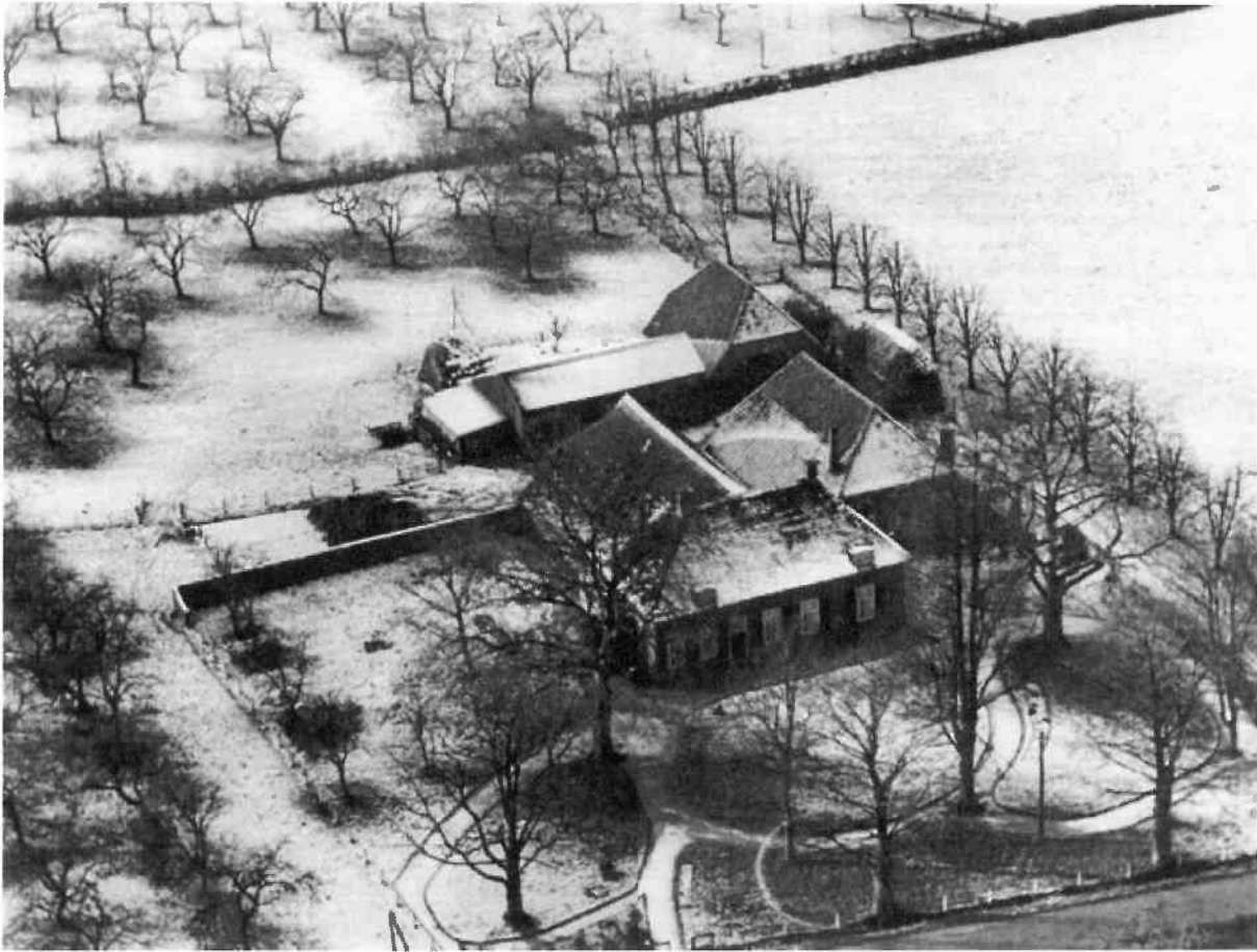
De Middenhof winter 1950